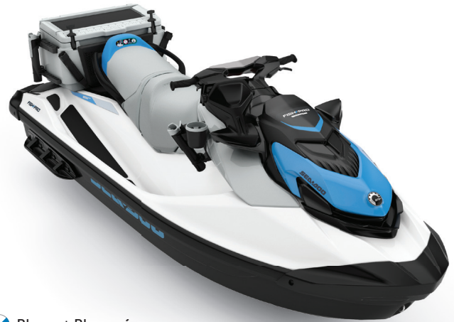
Blanc et Bleu océan