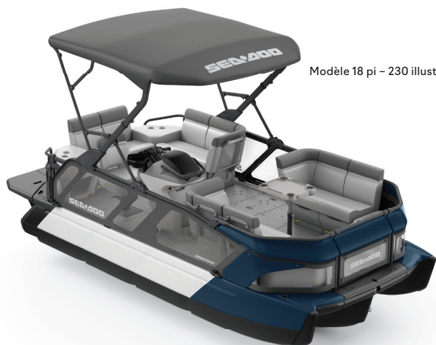
Modèle 18 pi - 230 illustré